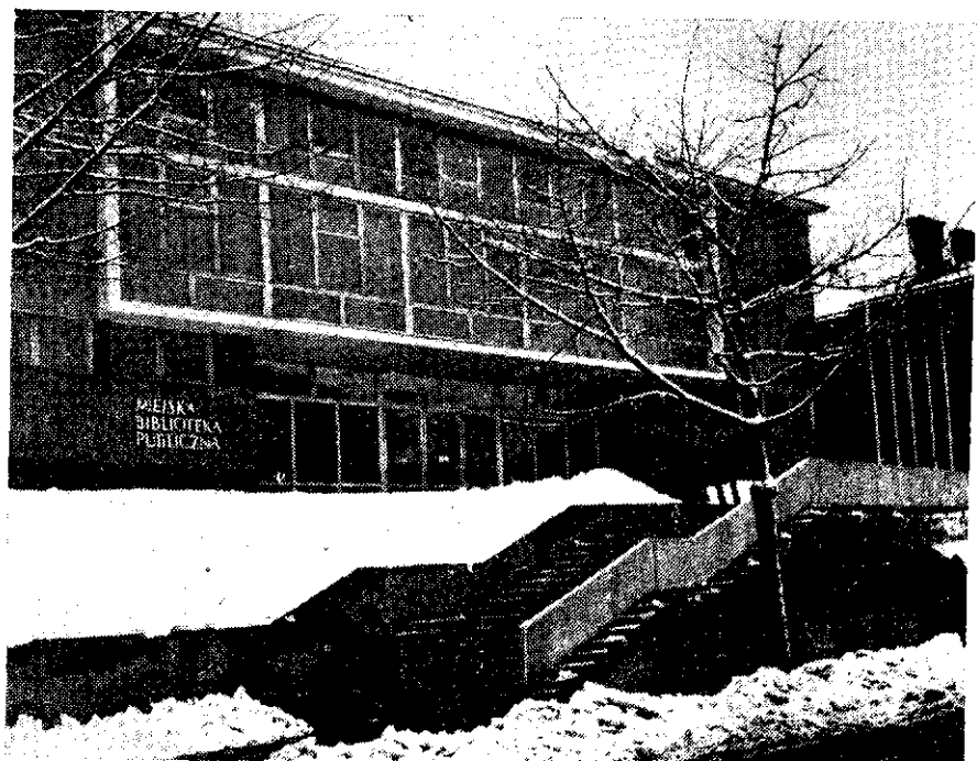
Budynek Miejskiej Biblioteki Publicznej w Bielsku-Białej

architektoniczną odpowiadającą funkcji obiektu. Celem zabezpieczenia księgozbiorów przed szkodliwym działaniem promieni słonecznych zastosowano specjalny gatunek szkła „Antisol”, w aluminiowej konstrukcji okien. Obiekt został wyposażony w niezbędne urządzenia wewnątrz i instalacje — łącznie z klimatyzacją, 4 windy towarowe i zdalacznym ogrzewaniem centralnym. Budynek posiada następujące pomieszczenia: