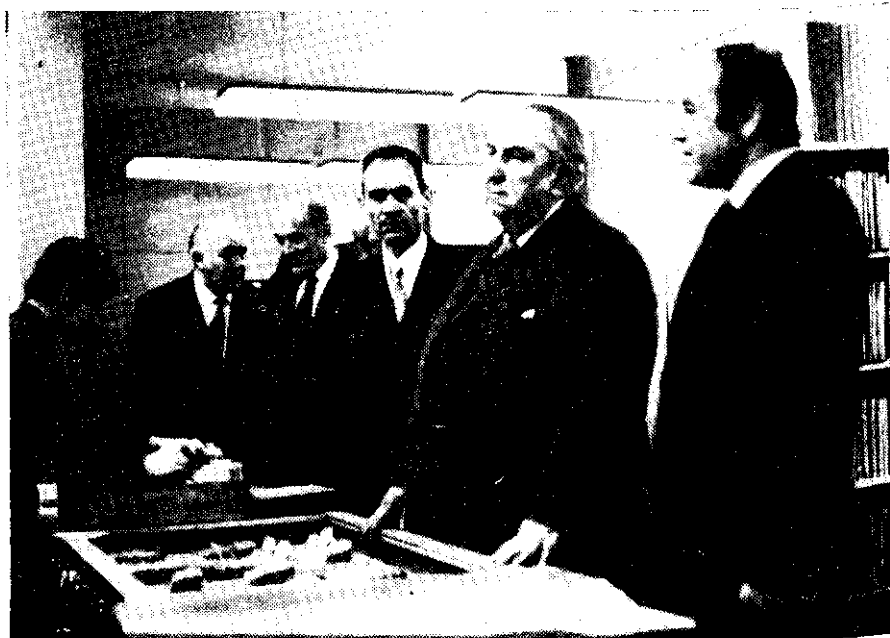
Gen. Jerzy Ziętek w towarzystwie innych osobistości podczas zwiedzania biblioteki

Budynek posiada trzy kondygnacje o łącznej powierzchni użytkowej 2.500 m 2 i kubaturze 10.500 m 3 . Całkowity koszt inwestycji wyniósł 18,5 mil. zł. Obiekt zlokalizowany został w sąsiedztwie szkół i budynków użyteczności publicznej. Budynek posiada spoistą formę