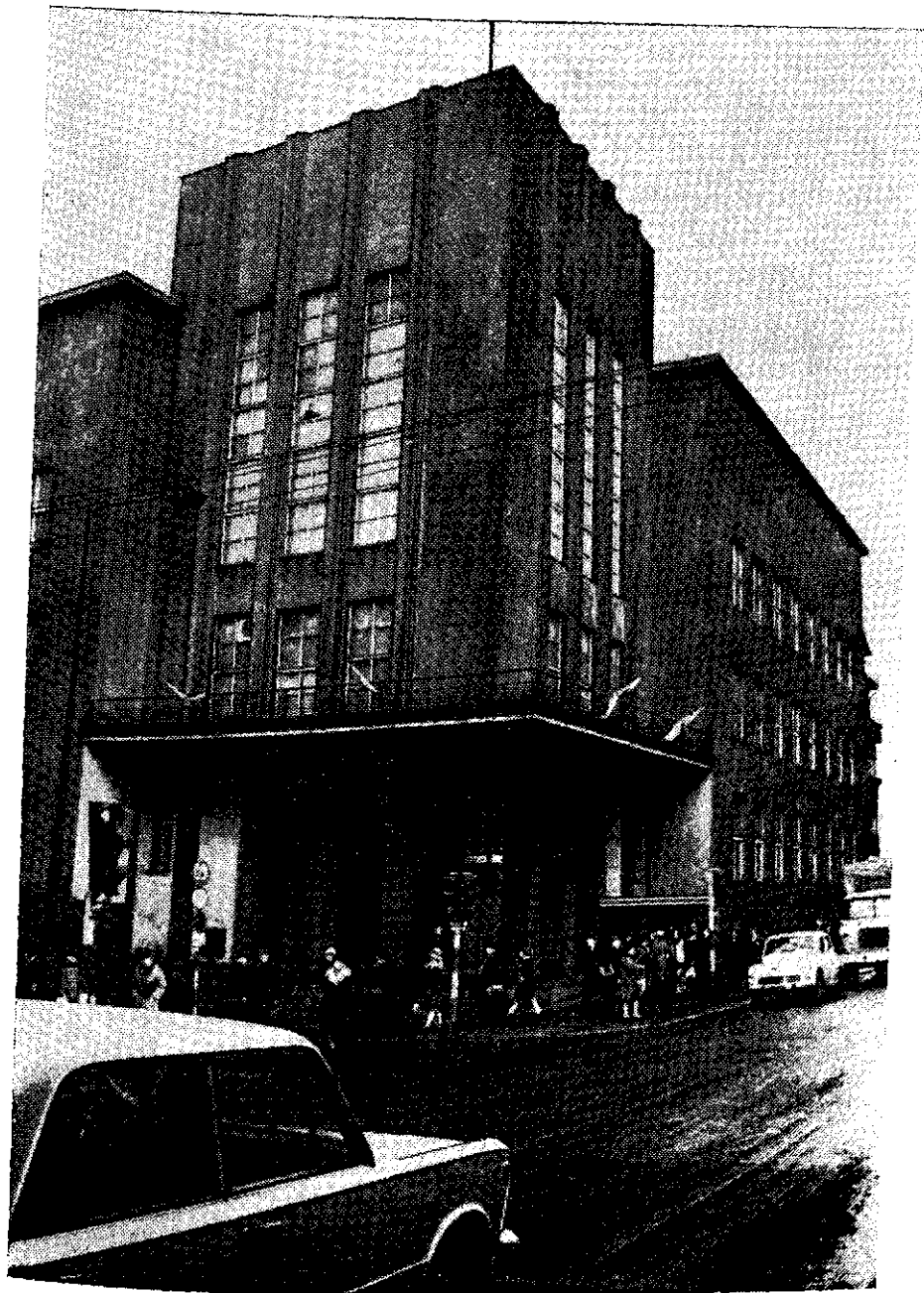
Gmach Biblioteki Śląskiej.